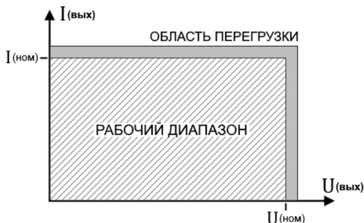
График зависимости тока от напряжения

возобновится. Если этого не происходит в течение длительного времени после остановки вентилятора, следует выключить прибор и включить повторно.